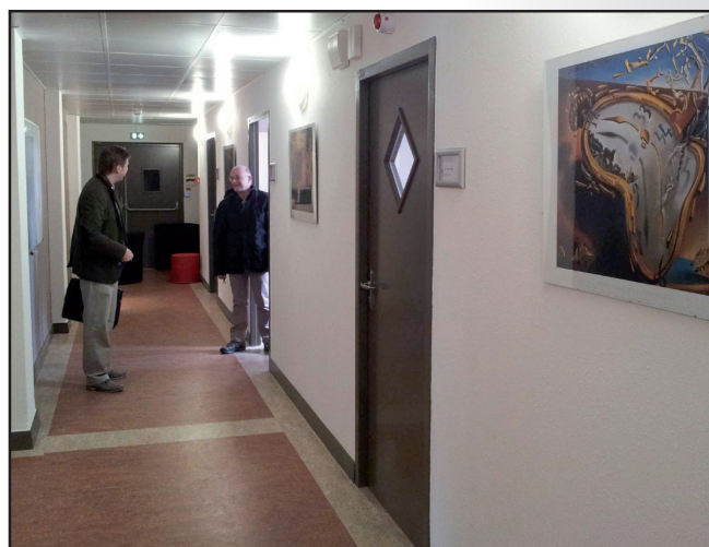
Locaux de l'équipe DALI - Université de Perpignan Via Domitia

Pour la virgule flottante, nos travaux concernent l'amélioration de la précision à l'aide de transformations sans erreur. Ce troisième axe rejoint la thèse de L. Thévenoux, pour la synthèse de codes avec compromis performance-précision. L'enjeu est de déterminer quelles parties de code transformer sans trop impacter les performances de l'application.